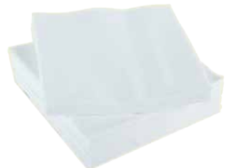
witte servetten of keukenrol