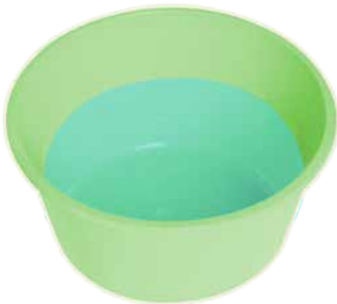
kom lauw water

Een goede luizenkam koop je bij de apotheker. De kam heeft hele fijne, hoekige tanden die zeer dicht bij elkaar staan en die niet plooiën.