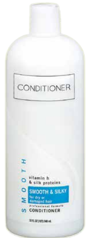
crèmespoeling, conditioner of balsem